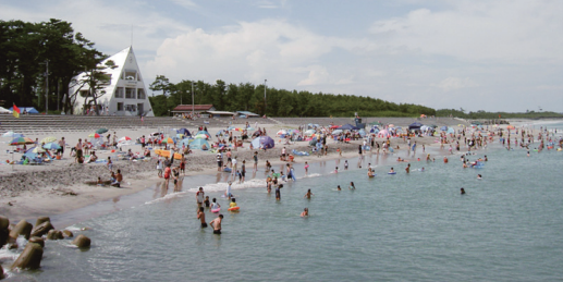
震災前の双葉海水浴場