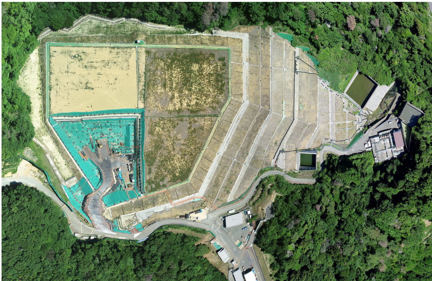
特定廃棄物埋立処分施設 （2026年6月1日撮影）