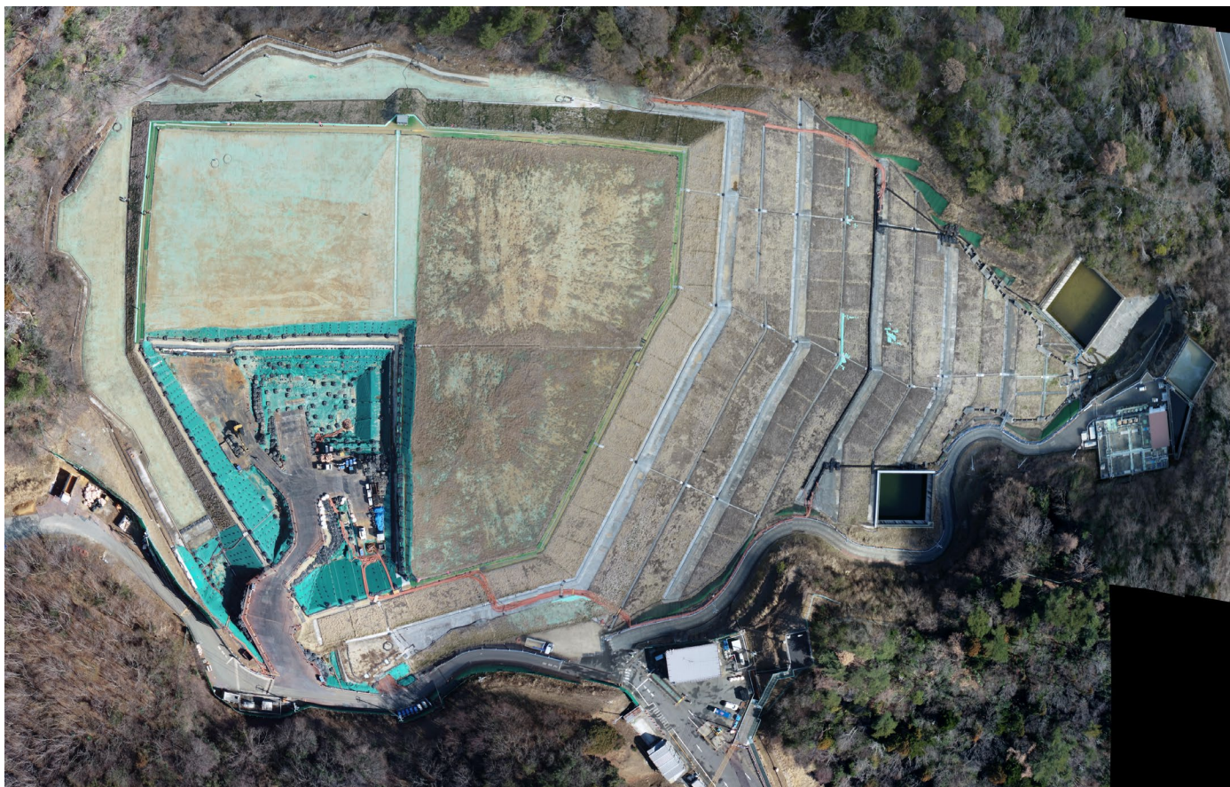
特定廃棄物埋立処分施設 （2026年3月16日撮影）