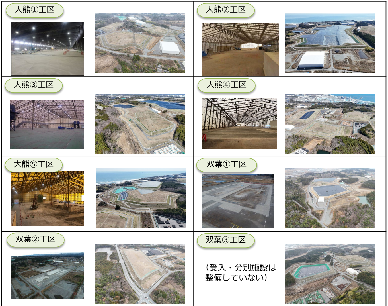
左の写真が受入・分別施設、右の写真が土壌貯蔵施設