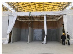
中間貯蔵施設区域（大熊町） テント内の軟化処理設備