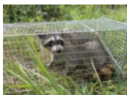
アライグマの捕獲