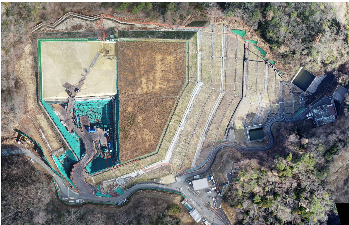
特定廃棄物埋立処分施設 （2026年1月6日撮影）