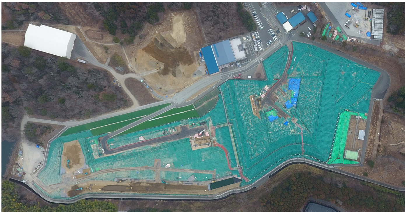
クリーンセンターふたば（2026年2月24日撮影）