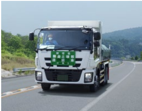
輸送車両の走行状況