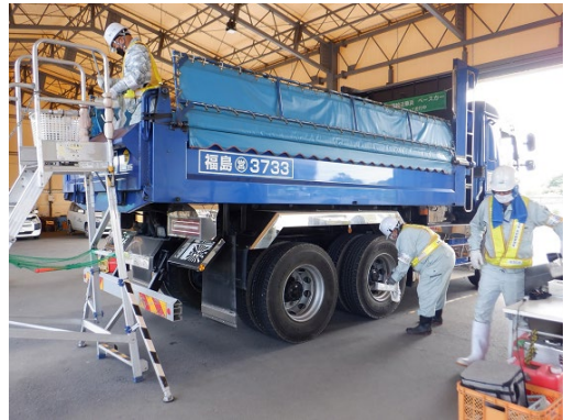
中間貯蔵施設からの退域前にスクリーニングをする輸送車両