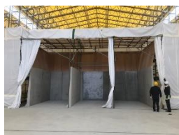
中間貯蔵施設区域（大熊町） テント内の軟化処理設備