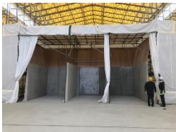
大熊町仮設焼却施設内の軟化処理設備