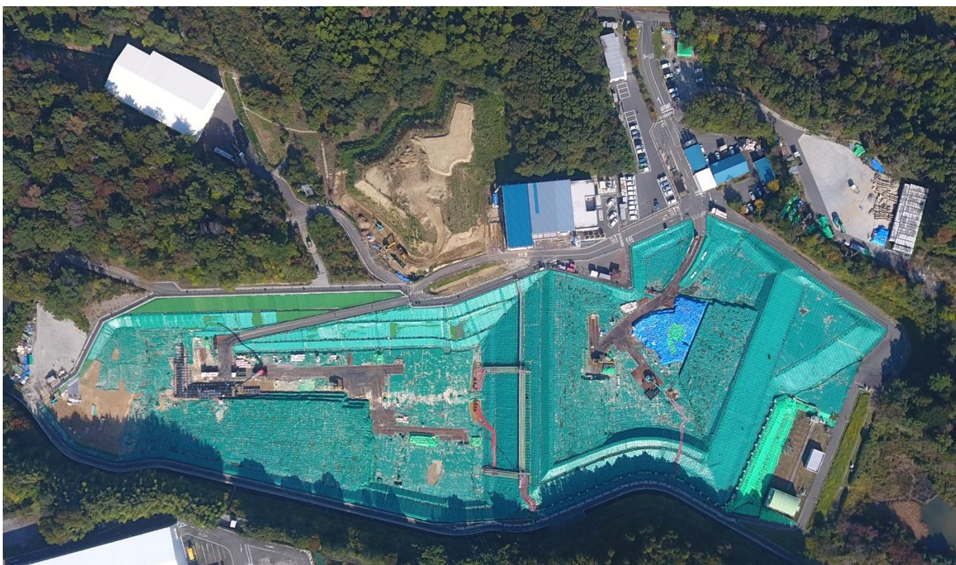
クリーンセンターふたば （2025年10月29日撮影）