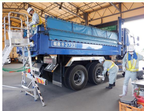
中間貯蔵施設からの退域前にスクリーニングをする輸送車両