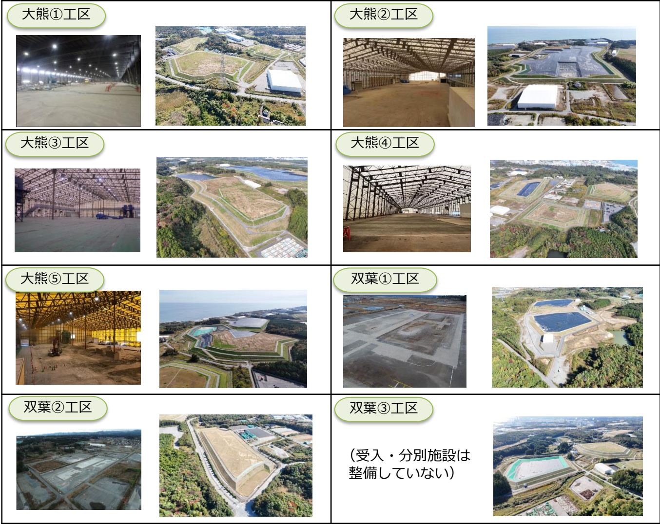
左の写真が受入・分別施設、右の写真が土壌貯蔵施設