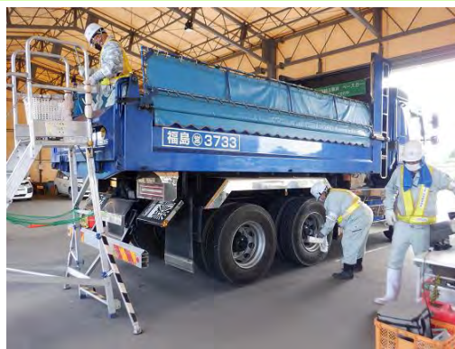
中間貯蔵施設からの退域前にスクリーニングをする輸送車両