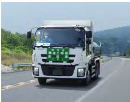
輸送車両の走行状況