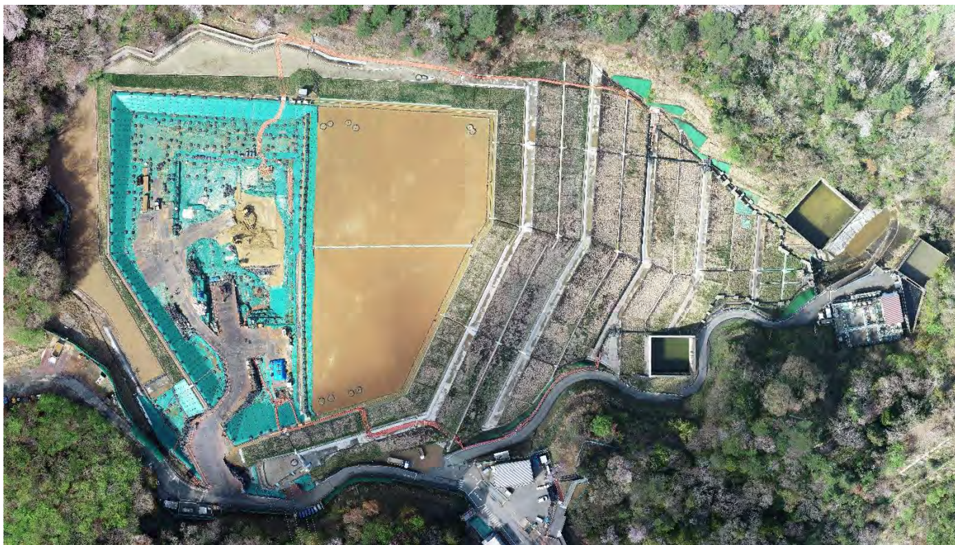
特定廃棄物埋立処分施設（2025年4月14日撮影）