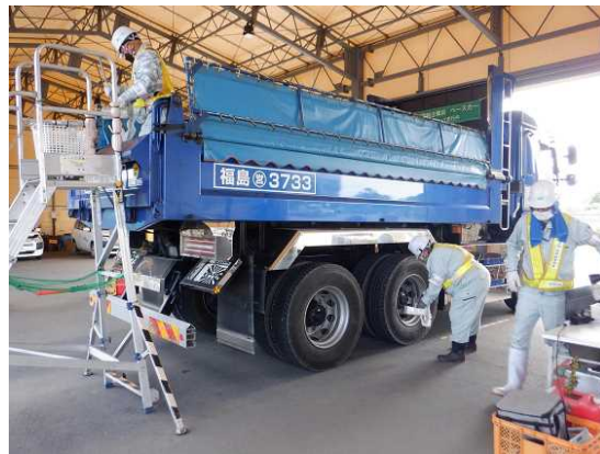
中間貯蔵施設からの退域前にスクリーニングをする輸送車両