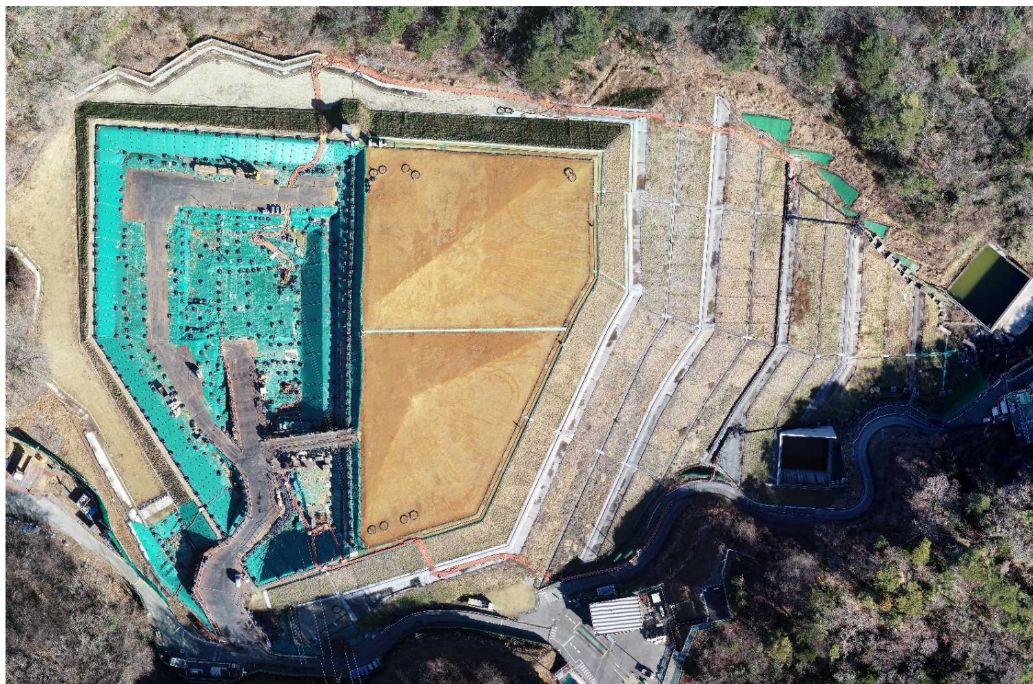
特定廃棄物埋立処分施設（2025年1月14日撮影）