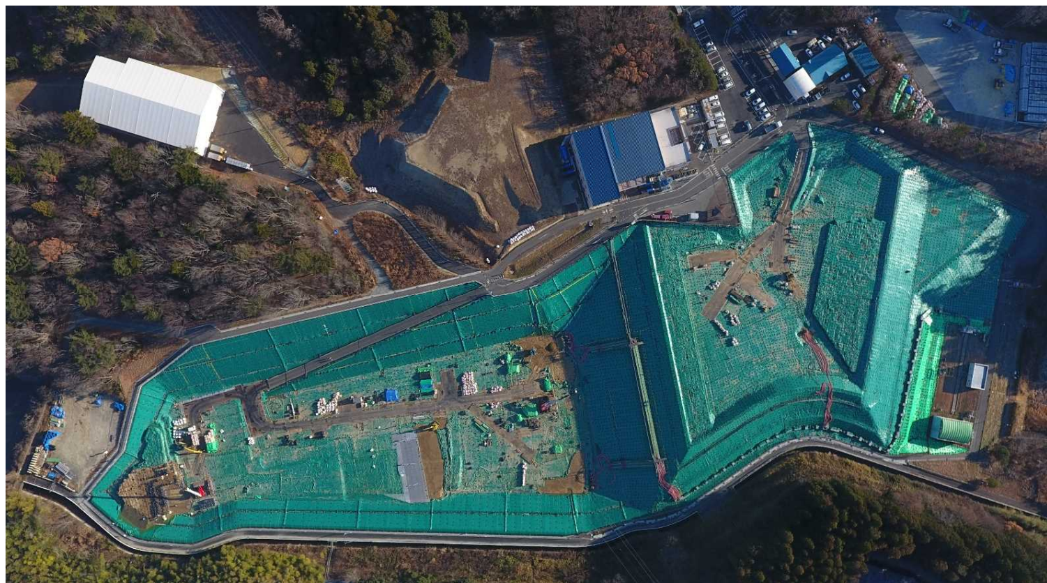
クリーンセンターふたば（2024年12月25日撮影）