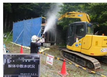
被災家屋等の解体の様子