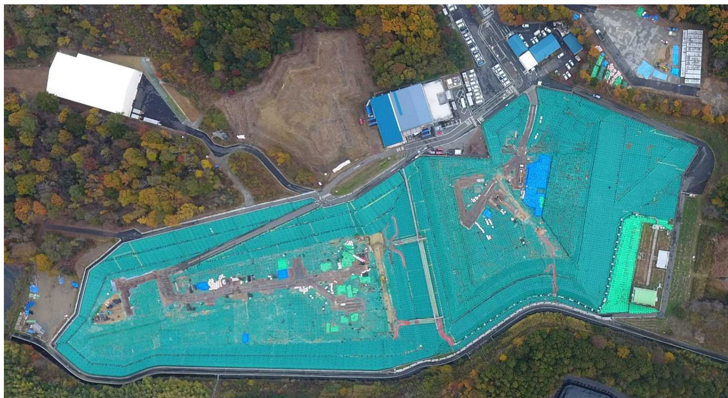
クリーンセンターふたば（2024年11月27日撮影）