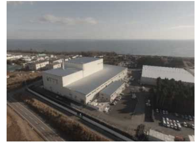
大熊町の仮設焼却施設