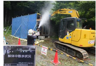
被災家屋等の解体の様子