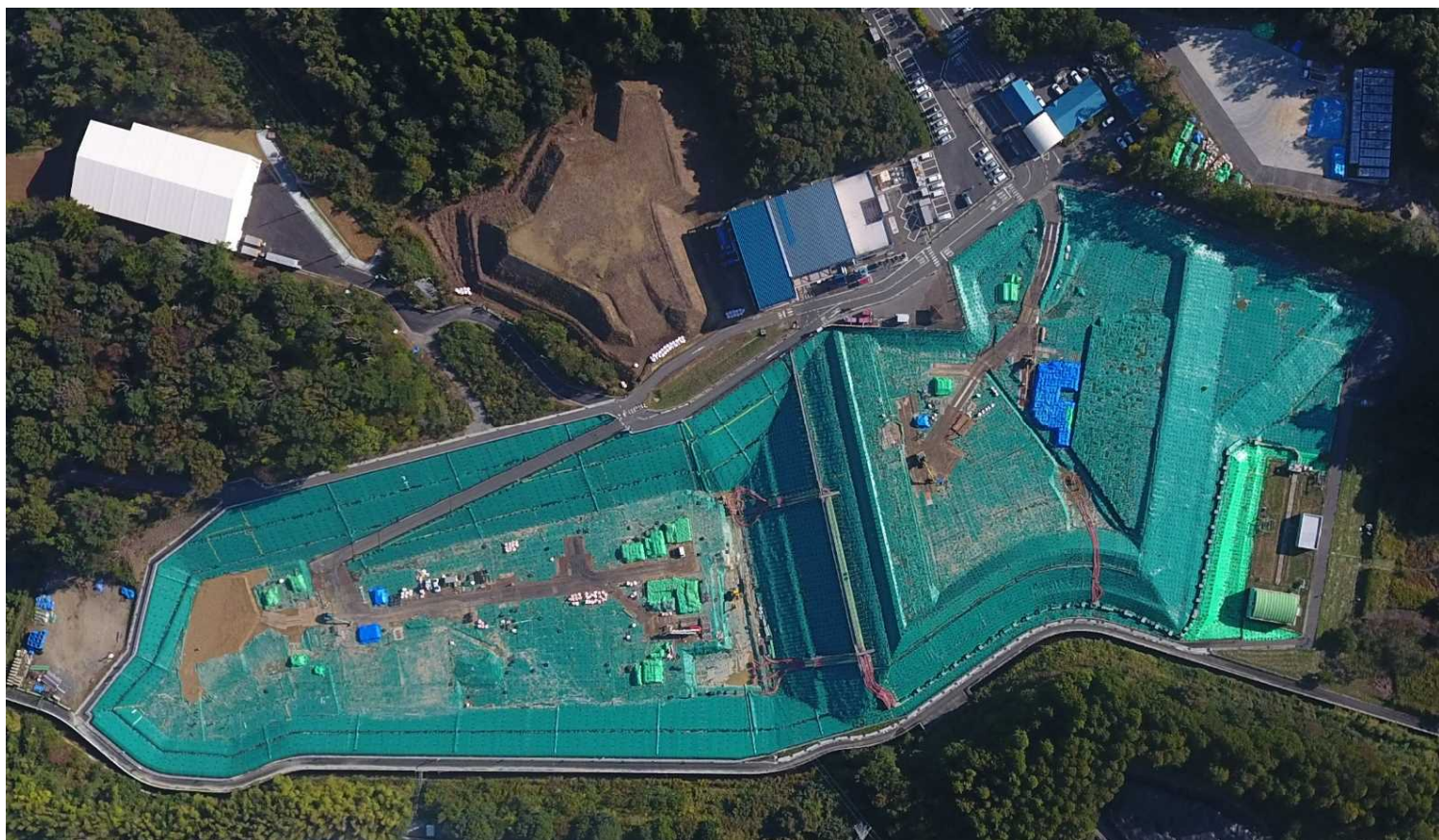
クリーンセンターふたば（2024年10月25日撮影）