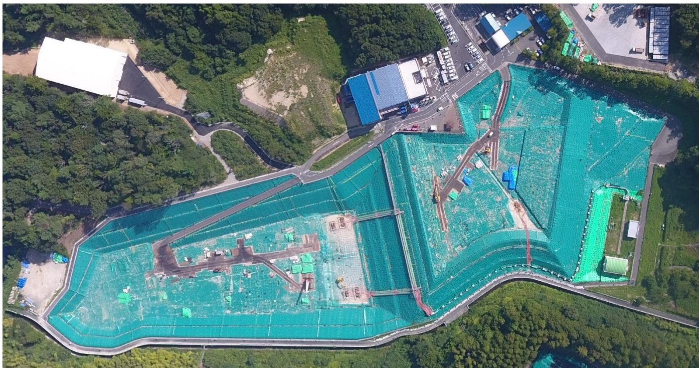
クリーンセンターふたば（2024年8月28日撮影）