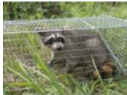
アライグマの捕獲