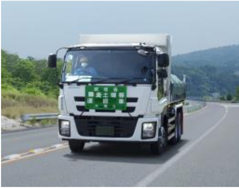
輸送車両の走行状況