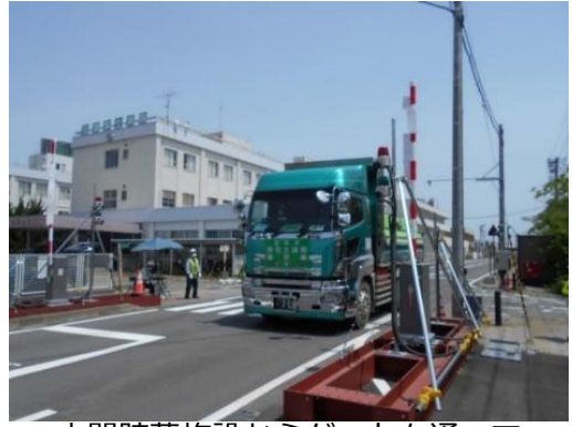
中間貯蔵施設からゲートを通して退却する輸送車両