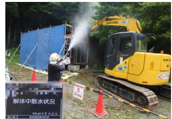
被災家屋等の解体の様子