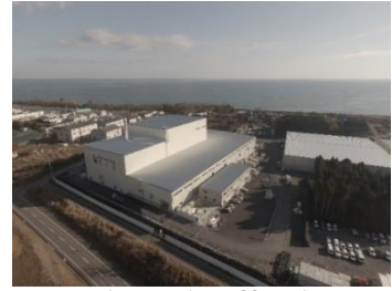
大熊町の仮設焼却施設