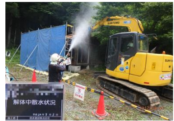
被災家屋等の解体の様子