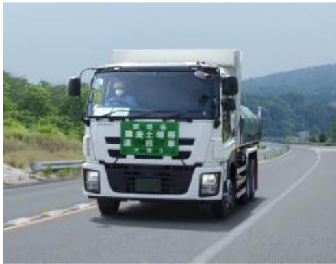
輸送車両の走行状況