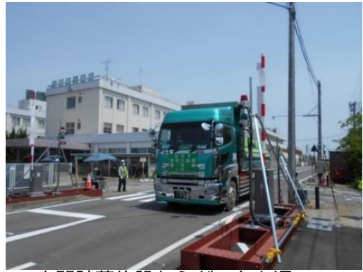
中間貯蔵施設からゲートを通して退域する輸送車両