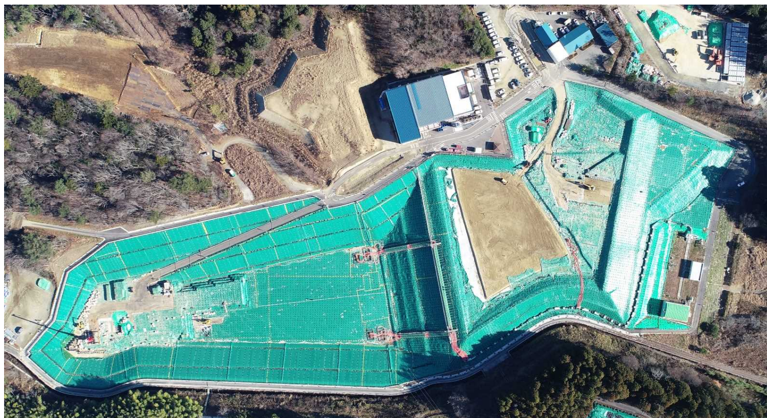
クリーンセンターふたば（2023年12月22日撮影）