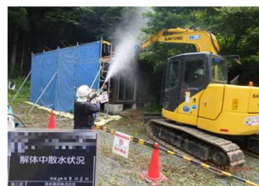
被災家屋等の解体の様子