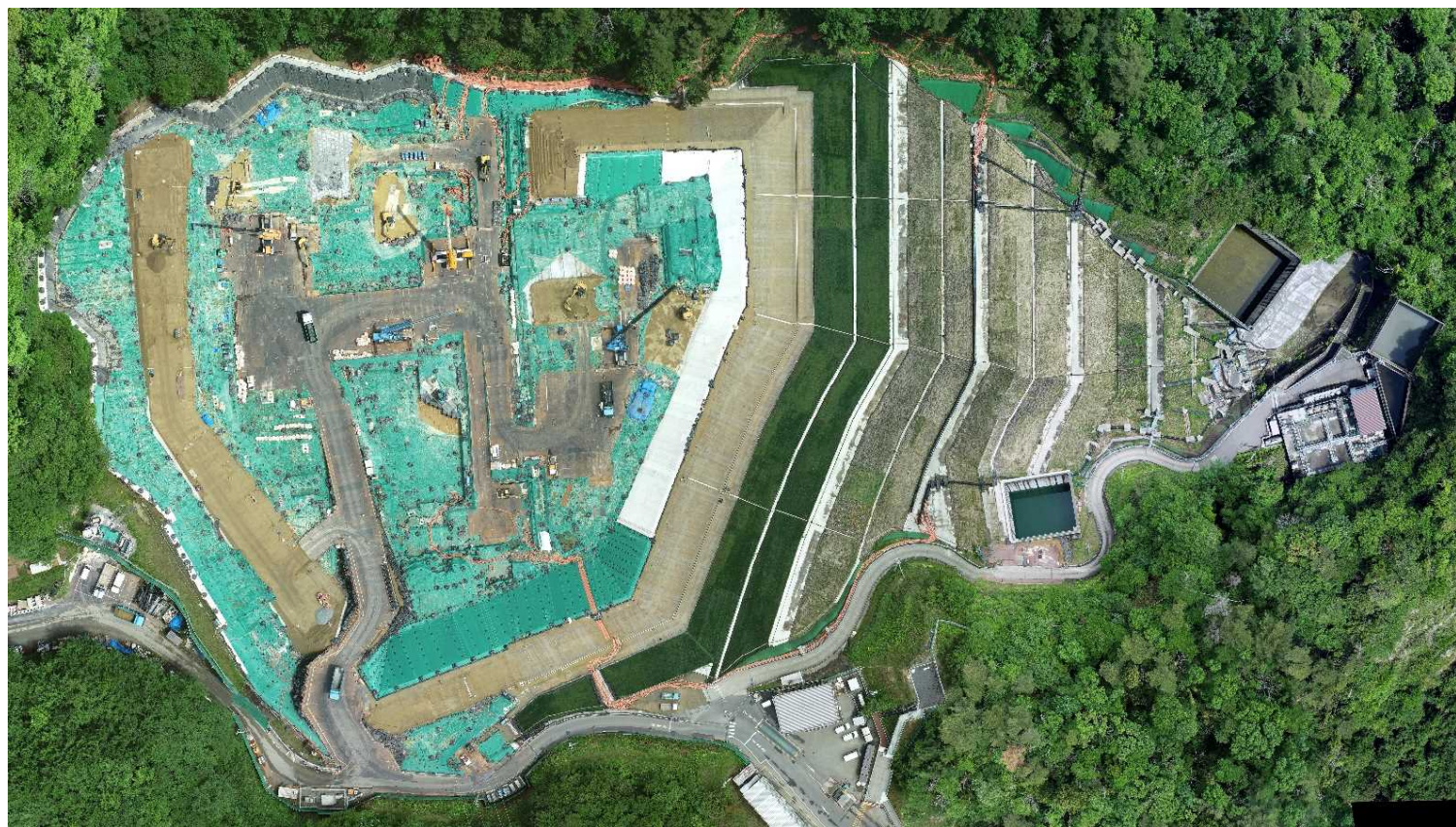
特定廃棄物埋立処分施設（2023年5月15日撮影）