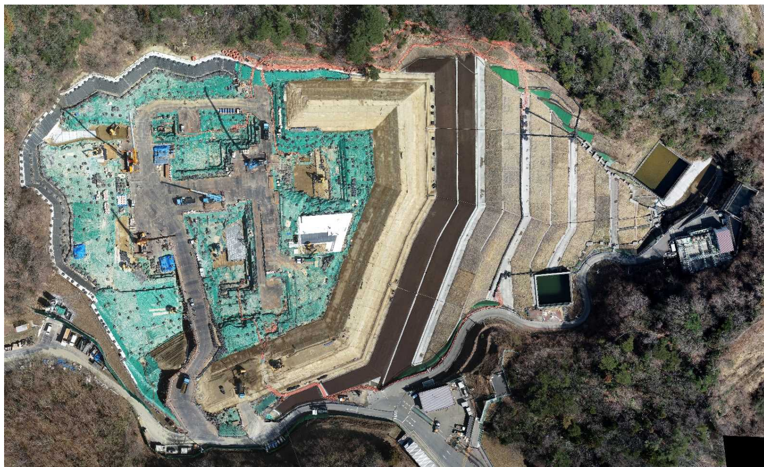
特定廃棄物埋立処分施設（2023年3月15日撮影）