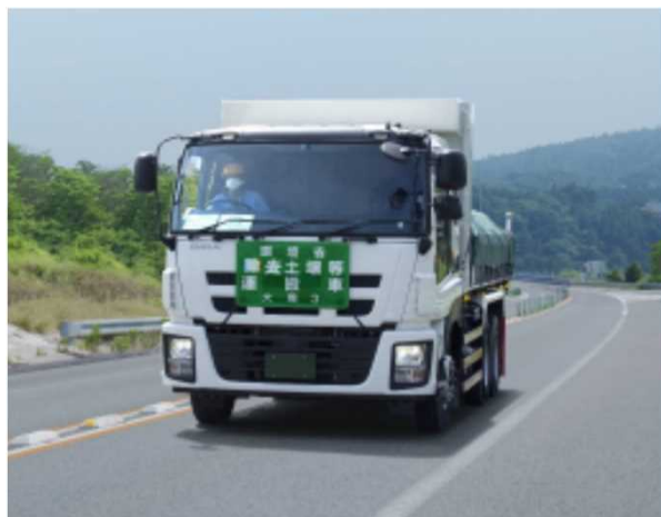
輸送車両の走行状況