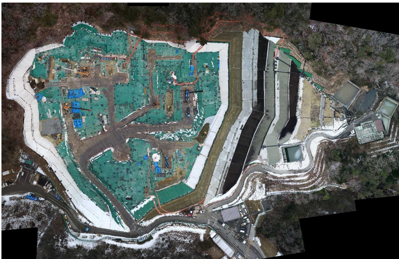
特定廃棄物埋立処分施設（2022年2月15日撮影）