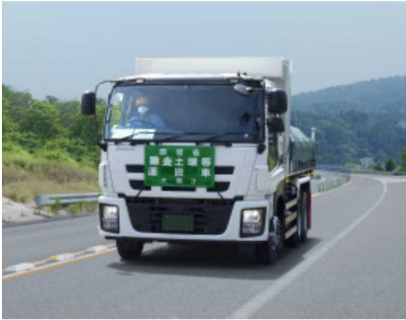
輸送車両の走行状況