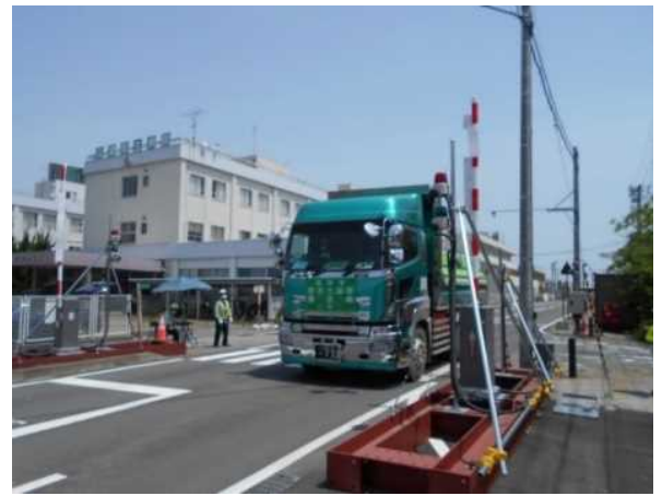
中間貯蔵施設からゲートを通して 退域する輸送車両