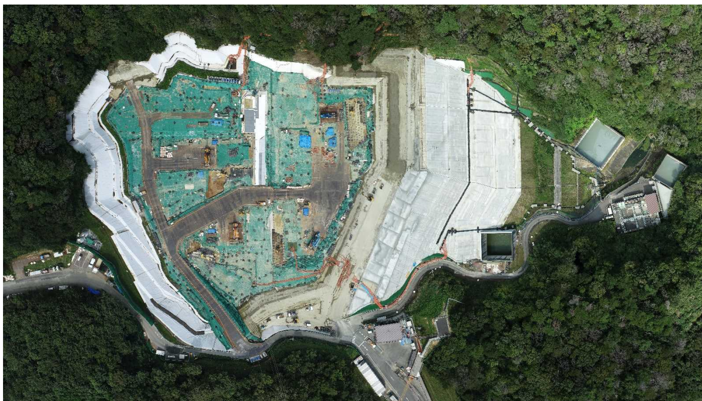
特定廃棄物埋立処分施設（2021年9月15日撮影）