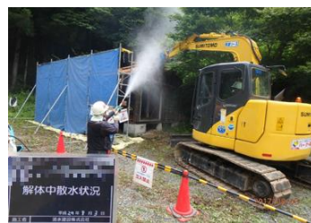
被災家屋等の解体の様子