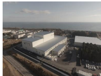
大熊町の仮設焼却施設