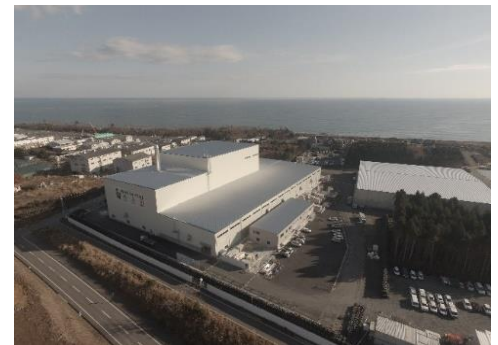
大熊町の仮設焼却施設