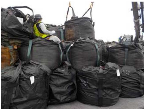
事故発生時の状況(再現)