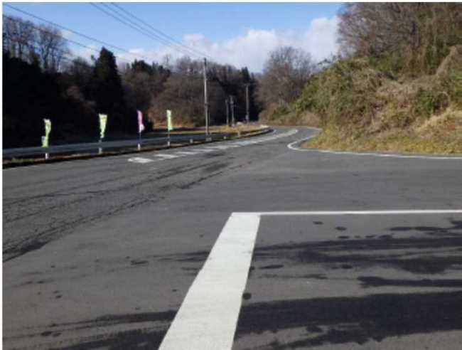
事故発生現場の状況(右手前:広域農道、奥:県道62号線)