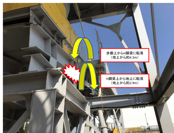
事故発生時の状況