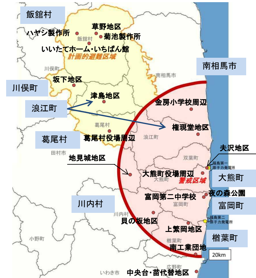
【 除染モデル実証事業対象地区の位置 】