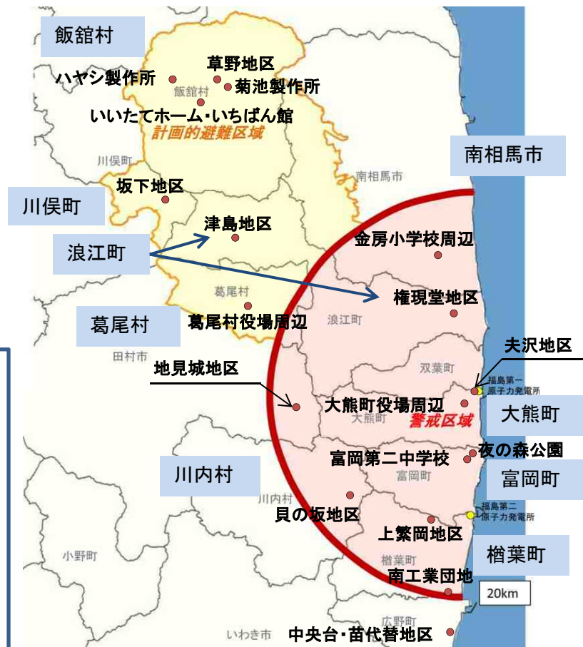
【 除染モデル実証事業対象地区の位置 】