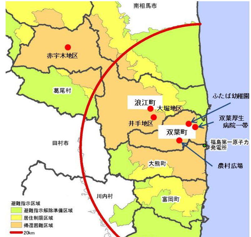
【 帰還困難区域除染モデル実証事業 対象地区の位置 】