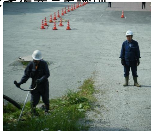
刈払教育実施状況