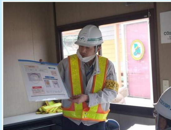
作業員への周知状況