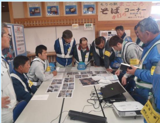
作業指揮者教育状況