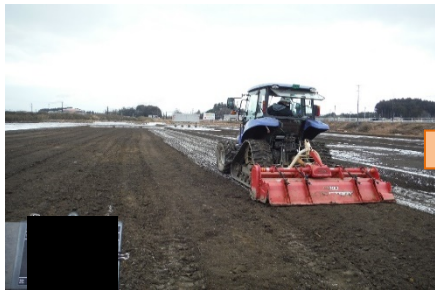
地力回復材の散布・耕起