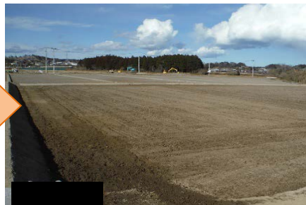
整地（均平化）終了時