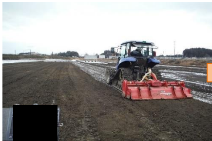
地力回復材の散布・耕起