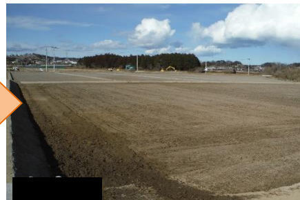
整地（均平化）終了時