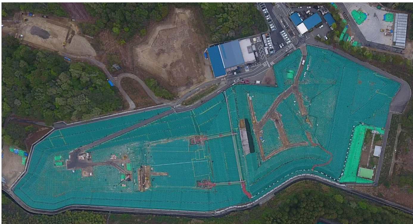
クリーンセンターふたば（2024年4月23日撮影）