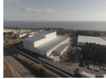
大熊町の仮設焼却施設