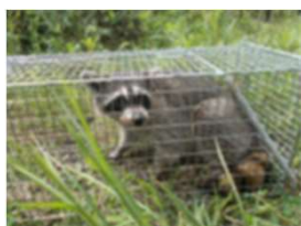
アライグマの捕獲