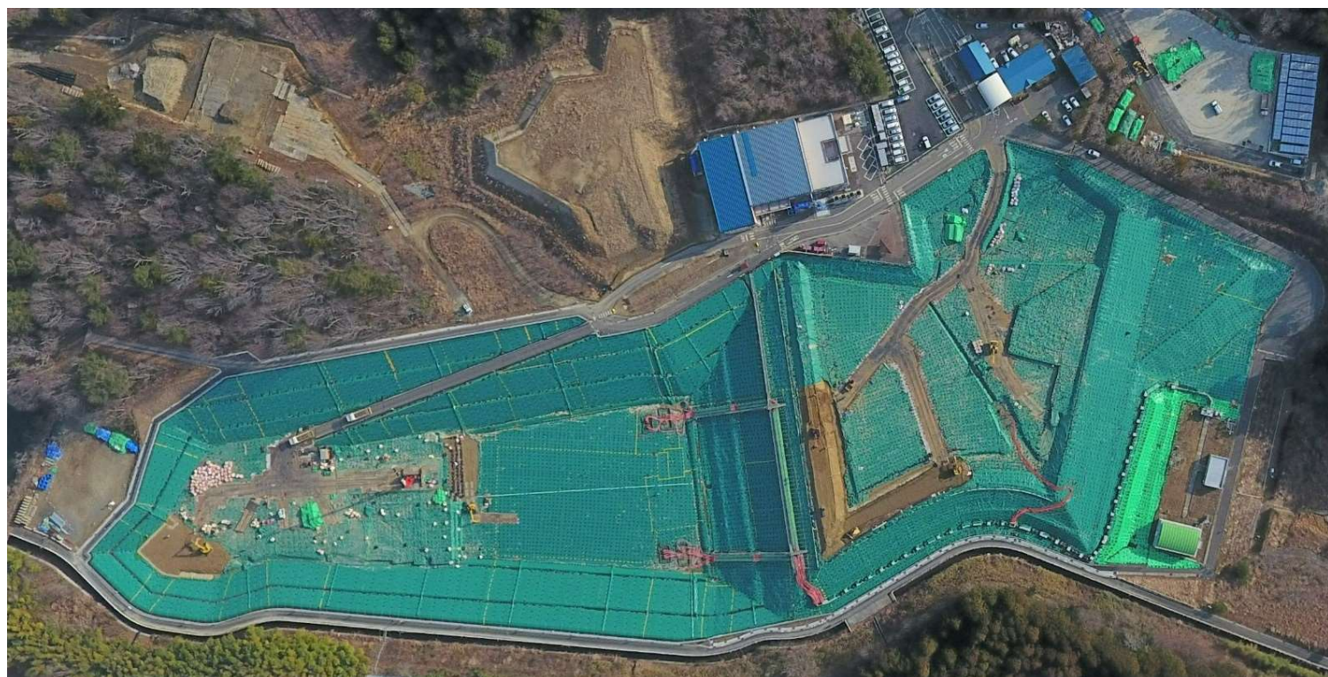
クリーンセンターふたば（2024年2月29日撮影）